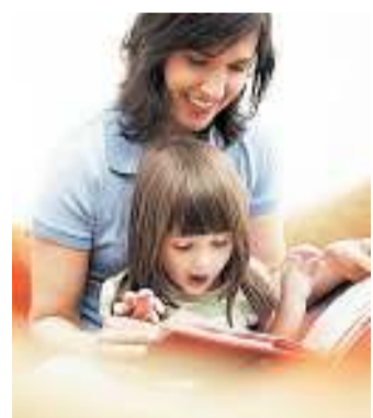
In libreria Letture per bambini da Feltrinelli a Chiaia

Quando: oggi Ore: dalle 11.30 Dove: Feltrinelli, piazza dei Martiri