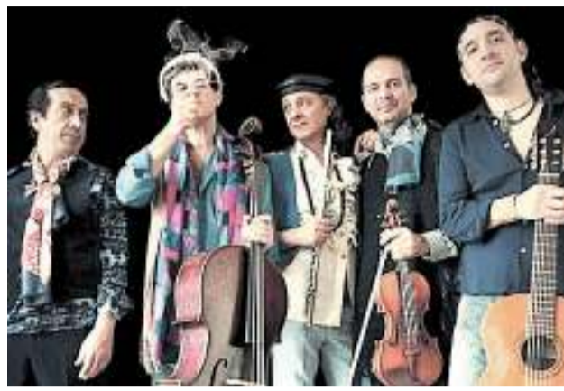
Cabaret da camera I Virtuosi di San Martino in «Rumors»

delle Generazioni di Firenze diretto da Francesco Durante, i Virtuosi presentano - per la prima volta nella loro ventennale carriera - un concerto di cover di note canzoni che, a vario titolo, fanno parte della storia della cosiddetta «musica leggera»: dalle piccole romanze all'italiana al rock progressive, da Kurt Weill ai Pink Floyd, dai Clash a Rino Gaetano, dai Police a Piero Ciampi, rivisitano alla propria folle maniera una pioggia estremamente eterogenea di canzoni - rumore di sottofondo. teatro Area Nord, via Nuova Dietro la Vigna 20, alòle 21